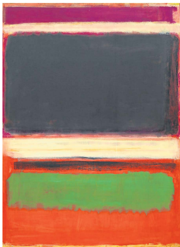
Mark Rothko, n° 3/n° 13, 1949, Huile sur toile (Museum of Modern Art, New York).

s'intéressent à l'art des Indiens d'Amérique. En quête d'une identité culturelle propre, imperméable aux références étrangères, les artistes américains tentent de retrouver dans l'inconscient et dans le mythe une énergie originale et fondatrice.