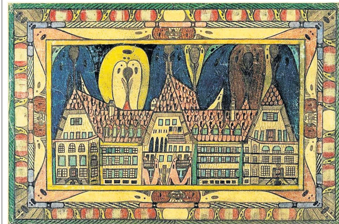
Adolf Wölfli, Heilanstalt Waldau, 1921.

Antikultureller Impuls und Suche nach dem Ursprünglichen