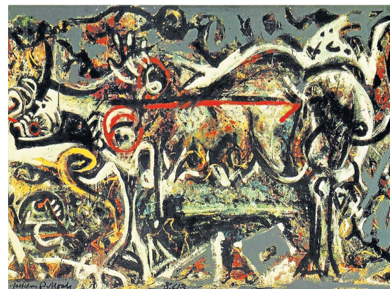
Jackson Pollock, The She-Wolf, 1943, huile, gouache et plâtre sur toile (The Museum of Modern Art, New York).

«Je ne fais pas une peinture de chevalier. Je ne tends pratiquement jamais ma toile avant de peindre. Je