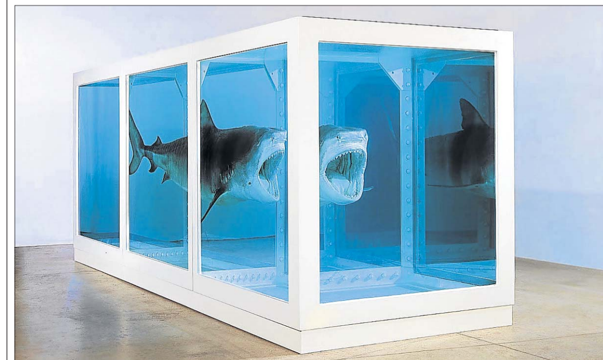
Damien Hirst: „The Physical Impossibility of Death in the Mind of Someone Living“, 1991.

Hirst indes hatte seine Lektion gelernt. 2007 war von ihm erneut die Rede, als er seinen ersten lukrativen Supercoup landete. Ein mit 8 601 Diamanten bedeckter Platinabguss eines menschlichen Schädelns mit dem Titel „For the Love of God“ wurde für 50 Millionen Pfund verkauft. Im Nachhinein bekam der Triumph freilich einen schalen Beigeschmack, als sich herausstellte, das Hirst selbst sowie sein Galerist Teil des Bieterkonsortiums gewesen waren und so einen Misserfolg der Auktion verhindert hatten. Hirsts ein Jahr später stattfindende Auktion, und vor allem ihr promi-