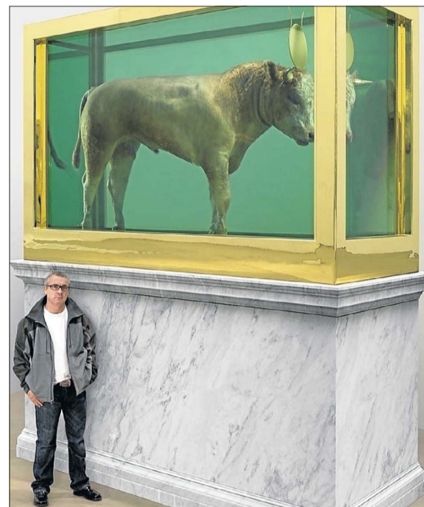
Damien Hirst vor seinem Werk „The Golden Calf“, 2008.

für 6,5 Millionen Pfund weitergekauft. 2007 war von ihm erneut die Rede, als er seinen ersten lukrativen Supercoup landete. Ein mit 8 601 Diamanten bedeckter Platinabguss eines menschlichen Schädelns mit dem Titel „For the Love of God“ wurde für 50 Millionen Pfund verkauft. Im Nachhinein bekam der Triumph freilich einen schalen Beigeschmack, als sich herausstellte, das Hirst selbst sowie sein Galerist Teil des Bieterkonsortiums gewesen waren und so einen Misserfolg der Auktion verhindert hatten. Hirsts ein Jahr später stattfindende Auktion, und vor allem ihr promi-