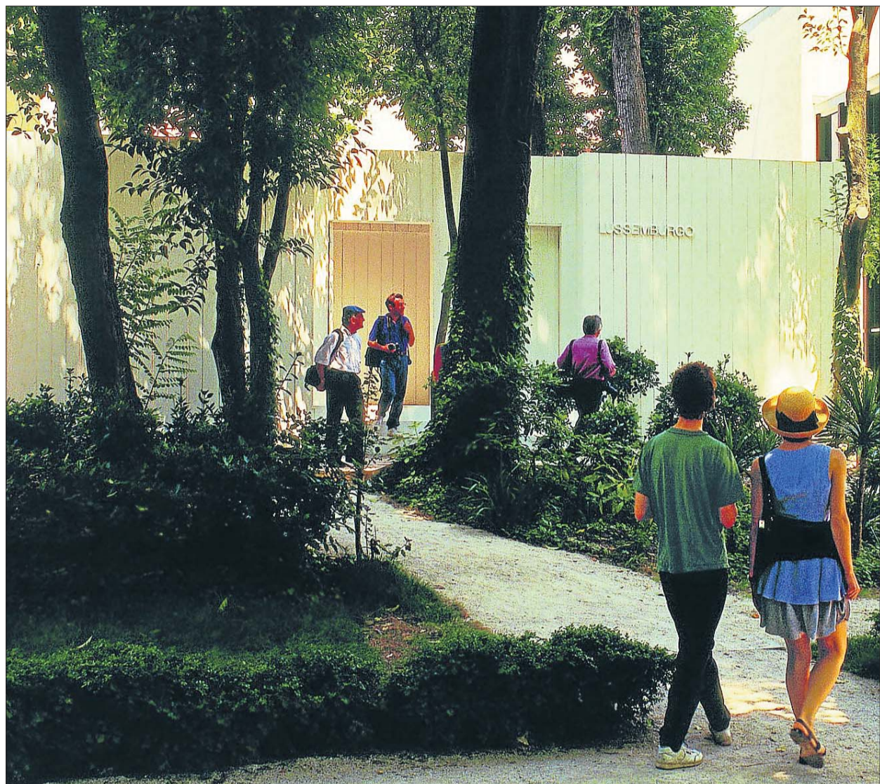
«Potemkin Lock», le pavillon luxembourgeois réalisé par Bert Theis à l'occasion de la Biennale de Venise 1995. (PHOTO: BERT THEIS)

Un des premiers pas vers une présence active du Luxembourg sur la scène artistique contemporaine fut initié avec le projet Potemkin Lock (1995) de l'artiste Bert Theis, invité par Enrico Lunghi, pour la représentation du Grand-Duché à la 46 e Biennale de Venise. L'intervention de l'artiste luxembourgeois captive alors l'attention des médias internationaux et trouve un écho important auprès du public. A cette date le Luxembourg n'a pas de pavillon national. Ses représentants exposent traditionnellement au pavillon italien, indispensible cependant aux artistes étrangers en cette année. Bert Theis crée alors un pavillon national luxembourgeois temporaire qui offre au public la possibilité de se reposer dans des transats. Le faux pavillon de Theis est constitué d'une façade ouverte sur une entrée qui mène, à travers un cou-