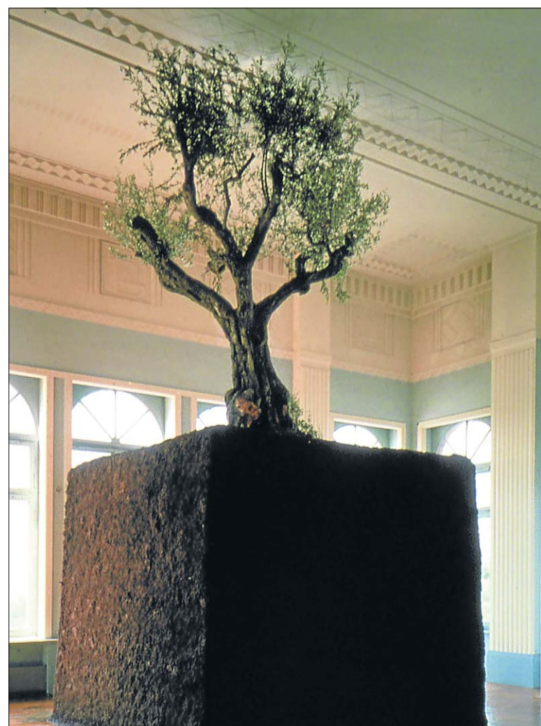
«Untitled» de Maurizio Cattelan, une création présentée lors de Manifesta 2 en 1998.