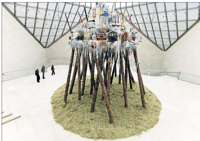
Pascal Marthine Tayou: «Home Sweet Home», 2011. Production réalisée spécifiquement pour le Mudam.