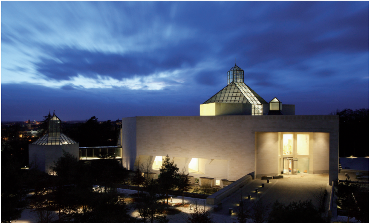
I. M. Pei Architect Design