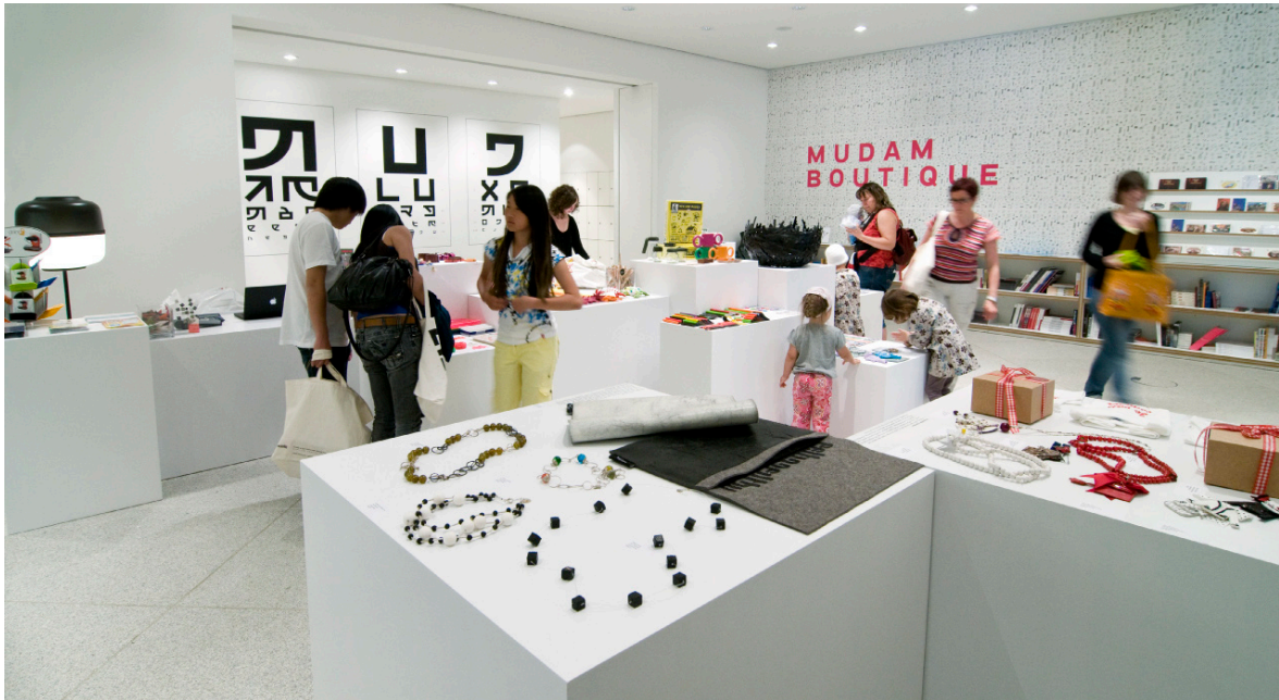
Mudam Boutique