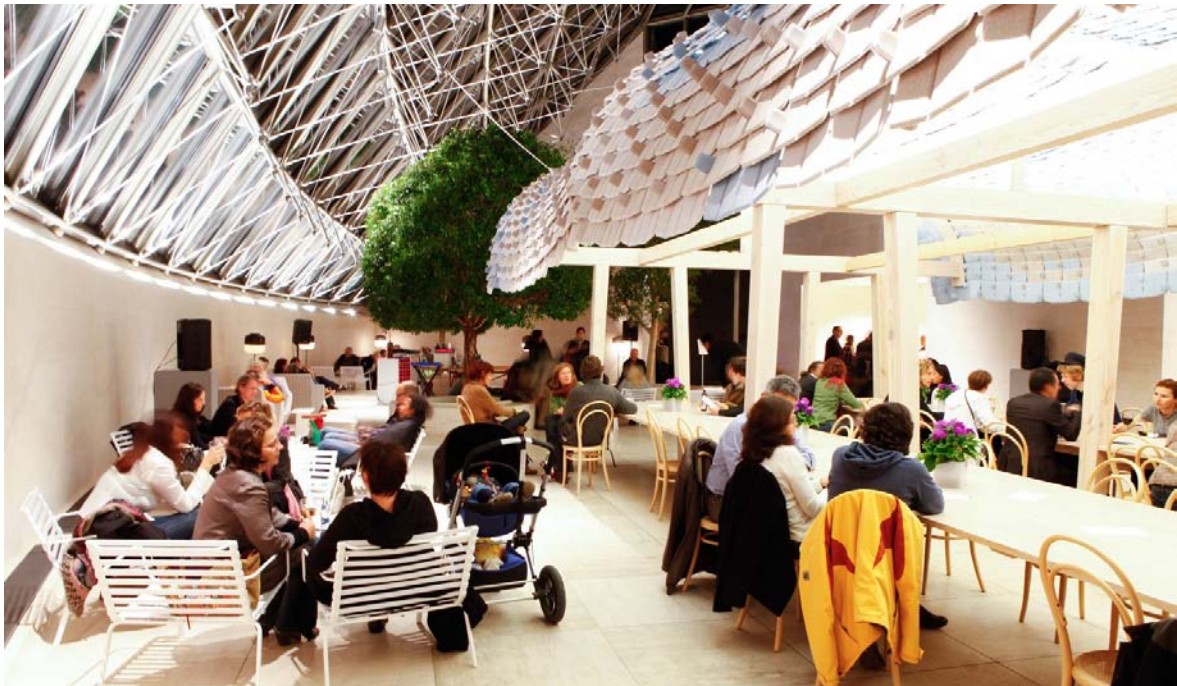
Erwan et Ronan Bouroullec : Mudam Café Design, 2006 Collection Mudam Luxembourg