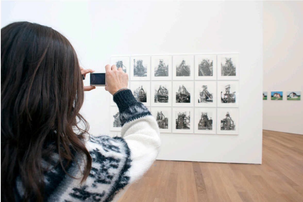
Vue de l'exposition Le Meilleur des Mondes