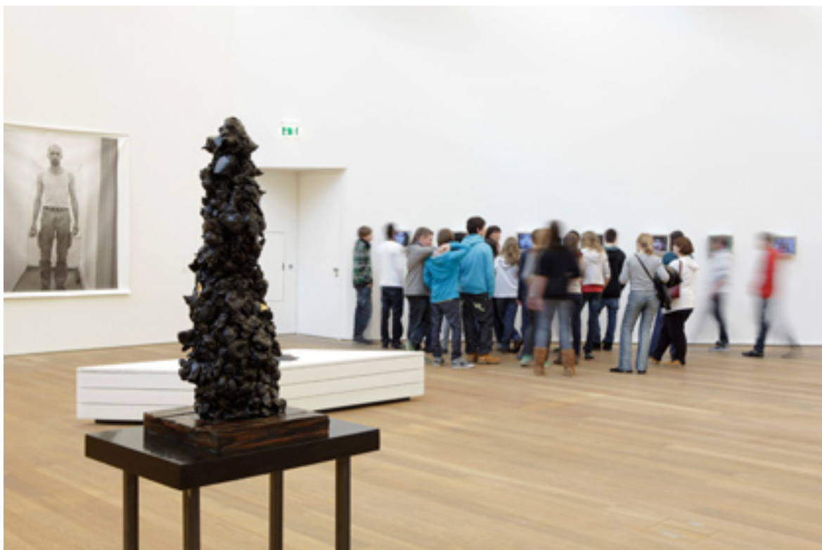
Vue de l'exposition Le Meilleur des Mondes